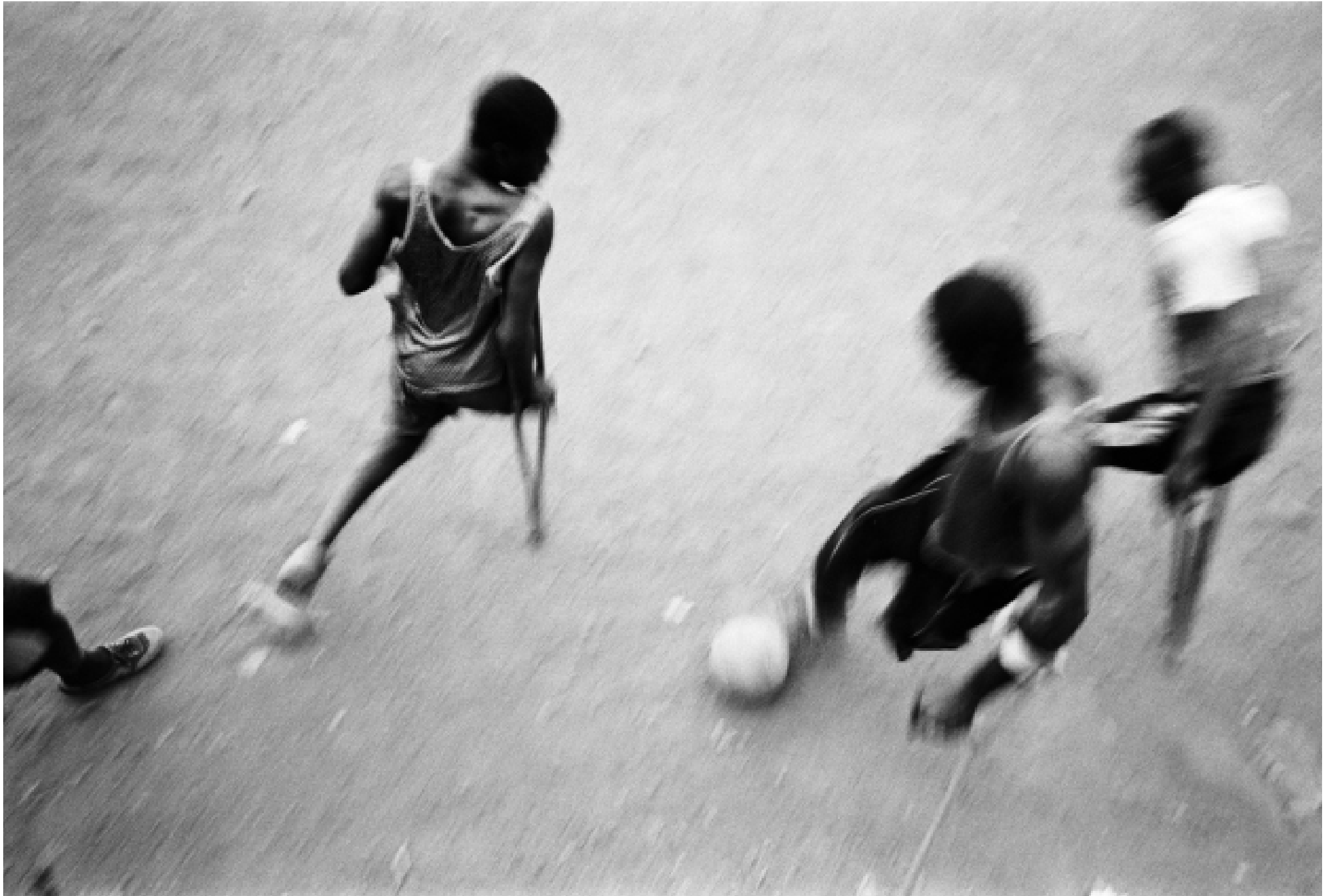
Imagen de la película One Goal de Sergi Agustí.